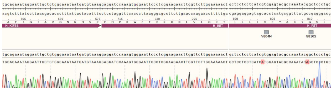
Fig 2. Sanger 测序结果